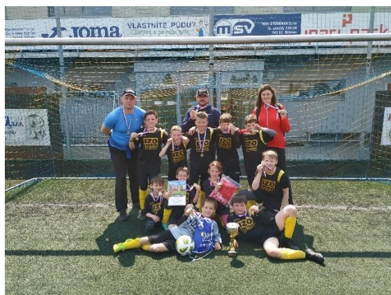
Obrázek 11: McDonald's Cup