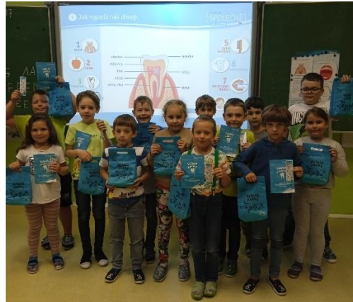
Obrázek 17: Program Veselé zoubky