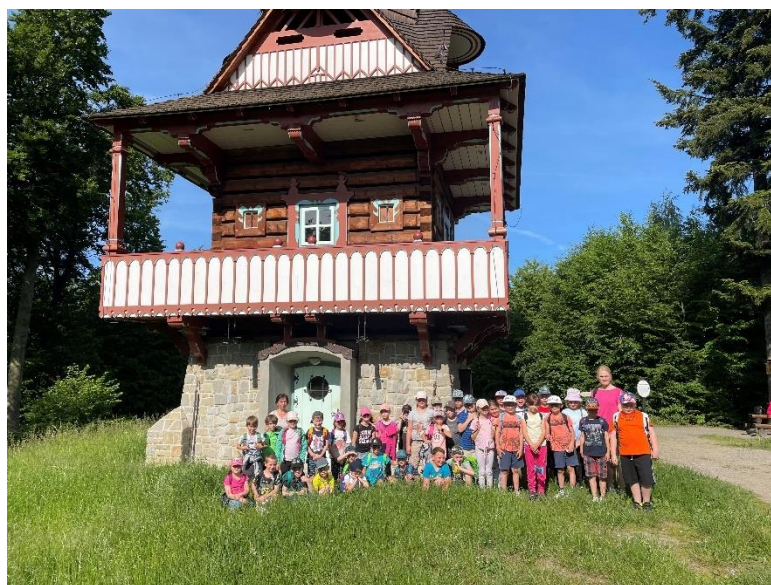
Obrázek 23: Školní výlet 1. a 2. třídy