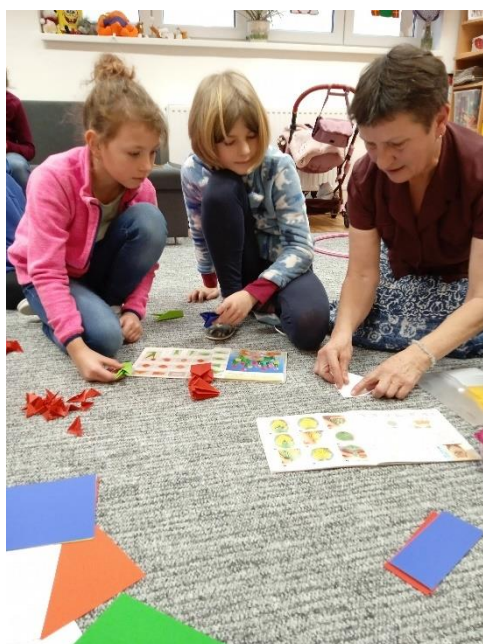
Obrázek 14: Kroužek origami