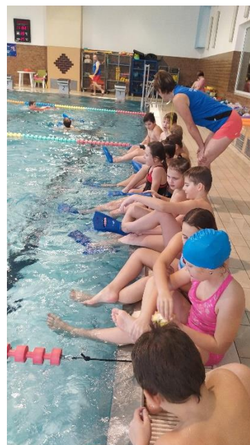
Obrázek 15: Plavecká výuka