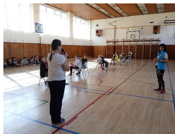
Obrázek 13: Švihadlový turnaj