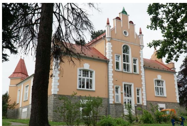
Obrázek 2: Budova MŠ