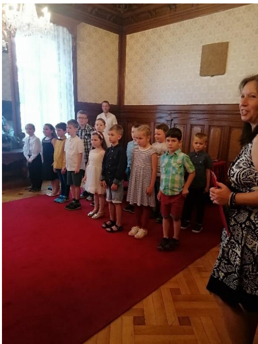
Obrázek 20: Pasování prvňáčků na čtenáře