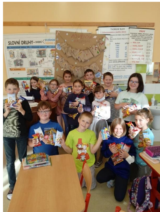
Obrázek 21: Mikulášská nadílka