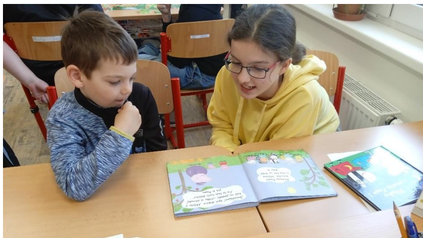
Obrázek 22: Čtení páťáků budoucím prvňáčkům

Základní škola a mateřská škola Tichá, příspěvková organizace • Tichá 282, 742 74 Tichá • IČO: 70986479 • datová schránka: 97zmifh • www.zsticha.cz • + 420 555 333 236 • skola@zsticha.cz