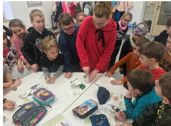
Obrázek 19: Den Země v ekocentru Hubert