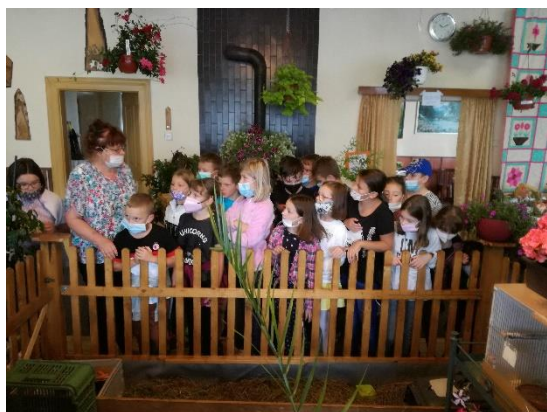
Obrázek 5: Výstava zahrádkářů