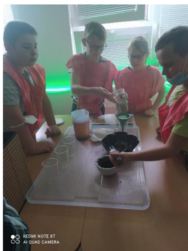
Obrázek 7: Program Strom života