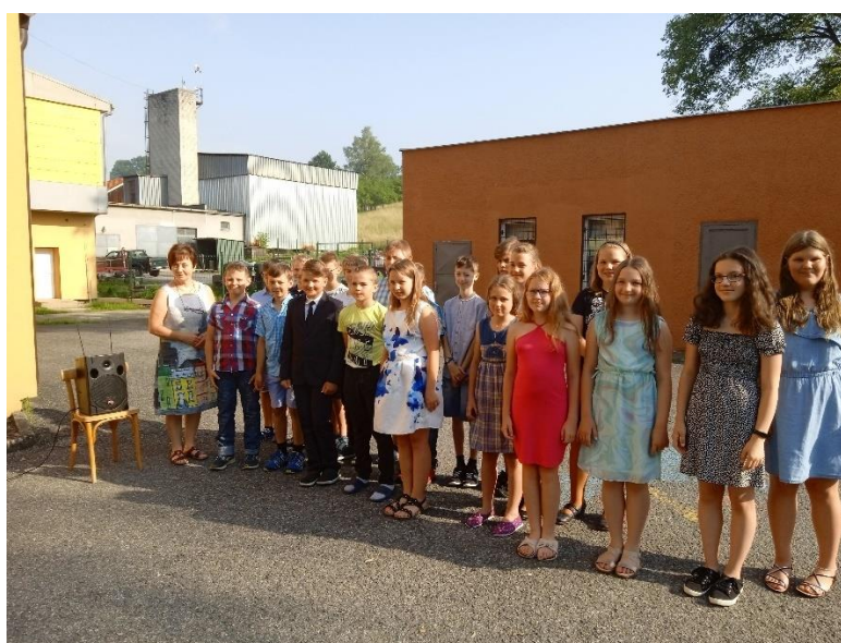
Obrázek 24: Rozloučení s žáky 5. třídy