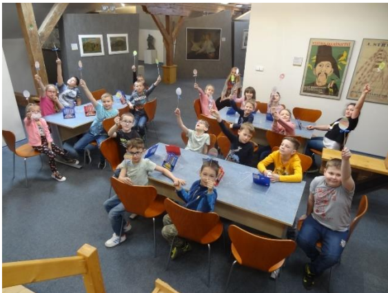
Obrázek 18: Program Velikonoce v muzeu