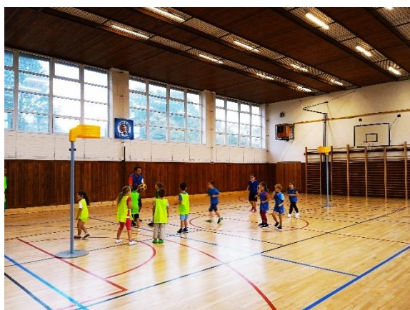
Obrázek 12: Kroužek korfbalu