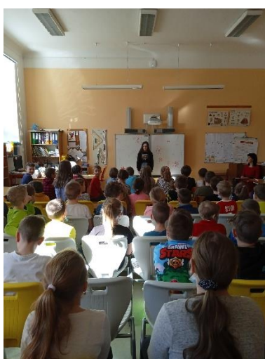
Obrázek 8: Recitační soutěž