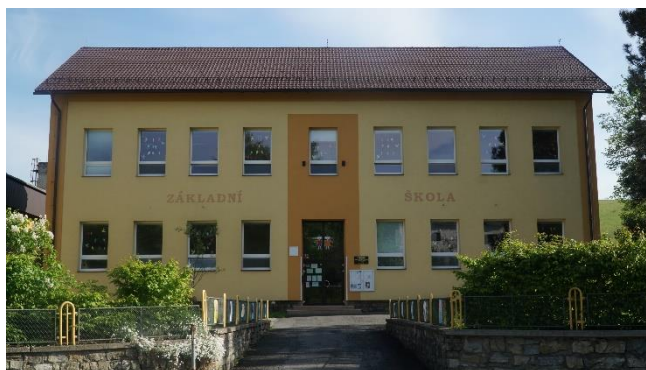
Obrázek 1: Budova ZŠ

Budova školy pochází z roku 1906. Je pětitřídní. Prostorné a světlé třídy, rozsáhlý venkovní areál, ve kterém se nachází hřiště, školní pozemek a letní dílna, zajišťují v budově optimální podmínky pro výuku. Letní dílna je stále využívána pro potřeby nejen žáků, ale i dětí ze školní družiny. Školní družina využila i hřiště u školy, multifunkční hřiště a také venkovní prostor u Tůňky. Tělocvična, školní družina a šatny jsou umístěny v přístavbě z roku 1991. Od 1. ledna 2003 je součástí základní školy i mateřská škola a školní jídelna. Ve škole je výdejna stravy, obědy se dovážejí z kuchyně mateřské školy. Vybavenost učebními pomůckami a didaktickou technikou je v budově školy na dostatečné úrovni.