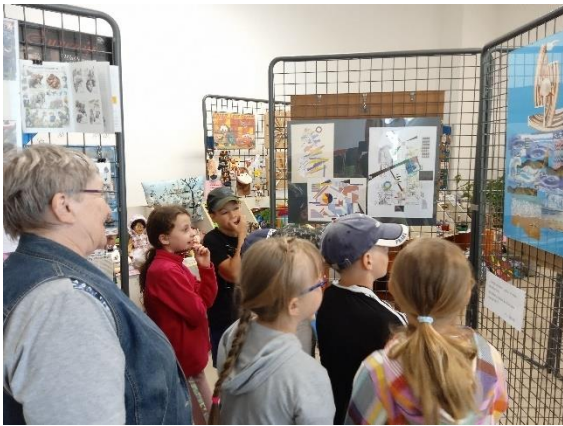
Obrázek 16: Návštěva výstavní síně v Tiché

Základní škola a mateřská škola Tichá, příspěvková organizace • Tichá 282, 742 74 Tichá • IČO: 70986479 • datová schránka: 97zmifh • www.zsticha.cz • + 420 555 333 236 • skola@zsticha.cz