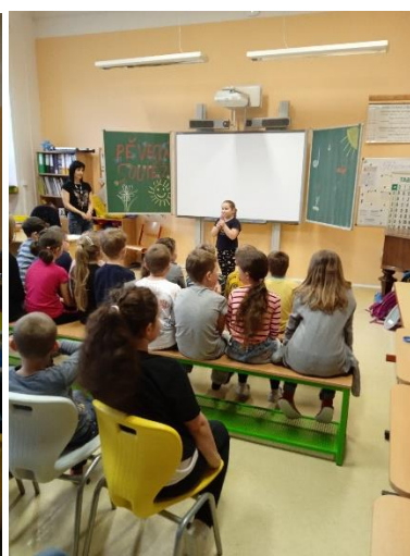
Obrázek 9: Pěvecká soutěž