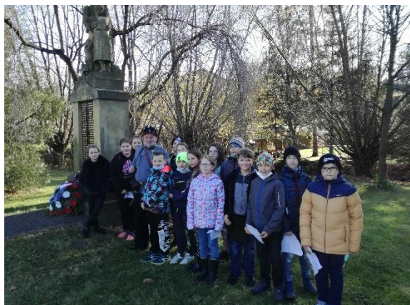
Obrázek 10: Den válečných veteránů