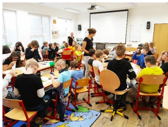
Obrázek 6: Týden vědy