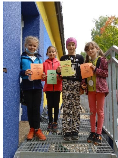
Obrázek 3 a 4: Závod o nejrychlejšího běžce